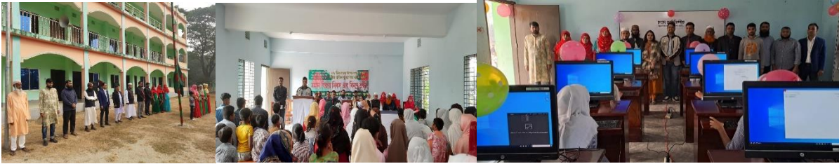
Siegesfeier und Eröffnung des Computerlabors am 16. Dezember 2022.