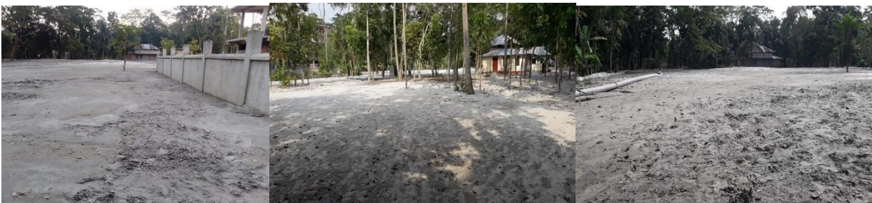
Kauf eines Grundstücks für das EBF-Spezialkrankenhaus

Die Euro Bangla Foundation hat bereits das Land für den Bau ihres EBF-Spezialkrankenhauses erworben. Es wird in der Folge versucht, Mittel für Landreparaturen, Bodentests und weitere Initialisierungen zu erhalten.