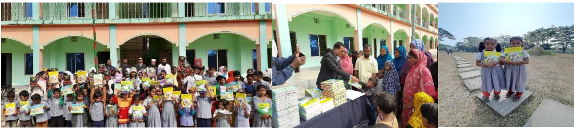
→Lehrbuchtag wurde dieses Jahr am 1. Januar gefeiert. Hier sind einige wertvolle Momente der kostenlosen Bücherverteilung an unseren geliebten Schüler in der Erleichterung der Euro Bangla Foundation Model Schule...