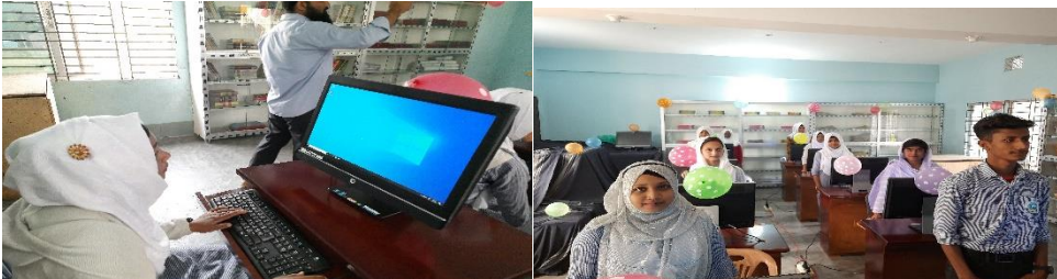
→ Ein Teil der Schüler erhält über Computerlabore Unterricht in moderner Bildung und praktischem ICT-Wissen.