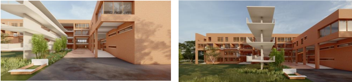
Vorgeschlagenes und für gut befundenes Design des Euro Bangla Mother and Childcare Hospitals

Wir haben bereits den endgültigen architektonischen Entwurf in Zusammenarbeit mit der VENNA Architectural Company entwickelt (siehe beigelegte Bilder) Mit erfahrenen Architekten stellen wir uns vor, ein modernes Krankenhaus zu bauen, so wie dies in ganz Europa üblich ist. Wir glauben an moderne Ausstattung und architektonisches Design. Dieses Krankenhaus wird die ländliche Bevölkerung dazu motivieren, in Fällen von medizinischen Notfällen unsere qualitativ hochwertigen medizinischen Dienstleistungen zu günstigen Preisen in Anspruch zu nehmen.