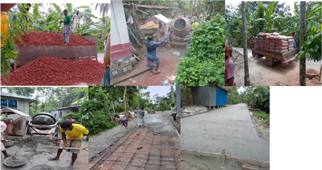
Strassenbauarbeiten für das geplante EBF Krankenhaus

Unter der Aufsicht der Euro Bangla Foundation wird der Bau der Straße vor dem Krankenhaus fortgesetzt, damit es beim Bau des Krankenhauses keine Hindernisse gibt und nach dem Bau des Krankenhauses ein sicherer Transport von Krankenwagen und Patienten gewährleistet werden kann.